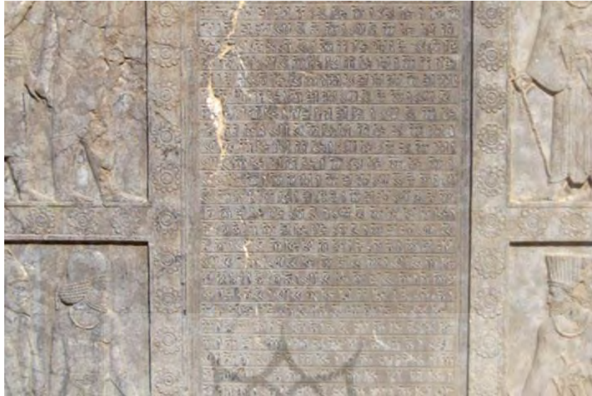
تصویر ۷. کتیبه‌های موجود در کاخ تچر. تخت جمشید. استان فارس

تاکنون در تخت جمشید کشف شده است و مکرر به لزوم ستایش خدای یگانه (اهورامزدا) بر طبق آیین بهی (ارث) و پرهیزگاری و نقوی اشاره می‌کنند (سامی، ۱۳۸۹: ۲۹۳).