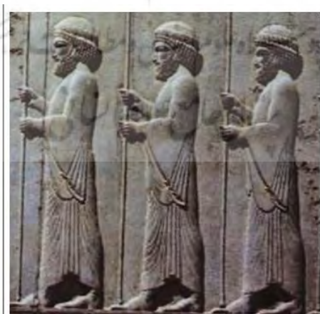
تصویر ۲. سربازان هخامنشی در نقوش برجسته پلکان شرقی تالار آپادانای تخت جمشید

از نظر برخی پژوهشگران تخت جمشید را نمی توان تنها مجموعه ای دینی یا آیینی دانست، بلکه باید آن را یک دژ یا ارگ حکومتی - سکونت گاهی دانست که از نظر نمادگرایی و مفهوم پردازی برای انجام سران آیینی و تشریفاتی نوروز طراحی شده بود. رابطه بین بخش های گوناگون صُفه نمایانگر مجموعه ای حکومتی و آیینی است (سلطانزاده، ۱۳۹۰: ۱۰۳). تخت جمشید آن نقش مرکز اداری را ایفا می کرد و برای پادشاه عنوان و پترینی برای قدرت به شمار می رفت که با مواد اولیه و نیروهای کار که از تمام نقاط شاهنشاهی آورده، احداث شده بود (ویزه هومر، ۱۳۹۷: ۱۰۶). تصویر شماره ۲ سربازان شاهی را ترسیم کرده است که گویای وجود نیروهای اداری و نظامی در تخت جمشید است.