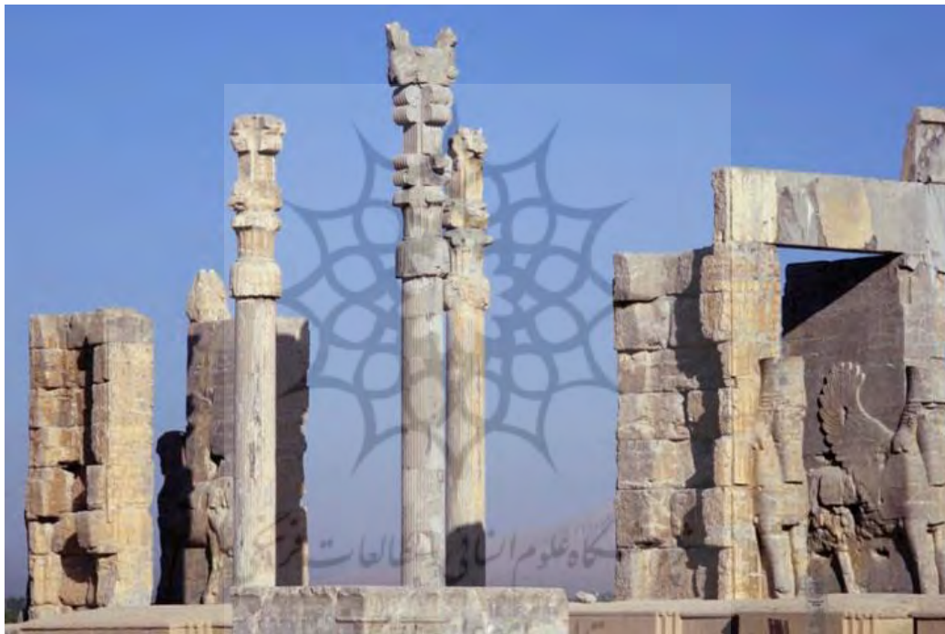
تصویر ۵. دروازه ملل، تخت جمشید. استان فارس

برگرفته از ظ بابلی بوده است» (قوتیفوس، ۱۳۸۰: ۱۳۶). دلیل انتخاب هنرمندان از سراسر جهان در ساخت این بنا، آشناکردن قدرت‌های منطقه با عظمت این کانون بود (نامی و همکاران، ۱۳۸۸: ۱۴۵). نقش حاملان تخت در نگاره‌های تخت جمشید در طول دوره امپراتوری هخامنشیان نیز کماکان گسترش یافت؛ به طوری که برای نمایش دادن ملل تابع امپراتوری که در حال حمل تخت شاهنشاهی هستند به کار می‌رفت. «در نقوش برجسته رستم که متعلق به آرامگاه شاهان هخامنشی هست، همیشه در حالت ایستاده است که بر روی یک سکوی مخصوص پله‌دار کوچک و بر روی صفحه مسطح دیگر قرار دارد که توسط نمایندگانی از ملل تابع حمل می‌شده است» (ایمان‌پور، ۱۳۹۶: ۱۷-۱۵). تصویر شماره ۵ که یکی از دروازه‌های بزرگ تخت جمشید، دروازه ملل است می‌تواند نشان از اهمیت این بنا در ساختاری اداری و سیاسی این بنا باشد.