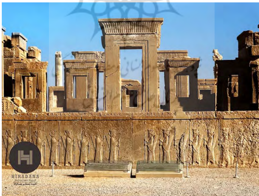
تصویر ۳. معماری تخت جمشید. استان فارس

اشتباهی که مورخین معاصر کرده‌اند این بود که تصور می‌کردند، کاخ پرسپولیس پرستشگاه بود و برای یک منظور مذهبی ساخته شد، اما می‌توان گفت که آن کاخ پرستشگاه نبوده، بلکه هدف اصلی آن بوده که یک موزهٔ بین‌المللی از صنایع و هنرهای ملل امپراتوری ایران و اقوام دیگر به وجود بیاید تا شکوه دولت و ارتش را به نظر ملل ایران و اقوام آن زمان برساند (موله و همکاران، ۱۳۸۰: ۶۸۹/۲). داریوش در سنگ‌نوشتهٔ بیستون اشاره می‌کند که این ارتش ثابت، پارسی و مادی نامیده می‌شود، به همین دلیل نگارهٔ پاسداران تخت جمشید که جامهٔ مادی به تن دارند تأییدی بر حضور مادها در یگان‌های پاسدار است، بنابراین اقوام مختلفی در تخت جمشید حضور داشتند (هد، ۱۳۹۴: ۲۲). تصویر شماره ۳ نمایی از شکوه این بنا را در معماری آشکار می‌سازد.