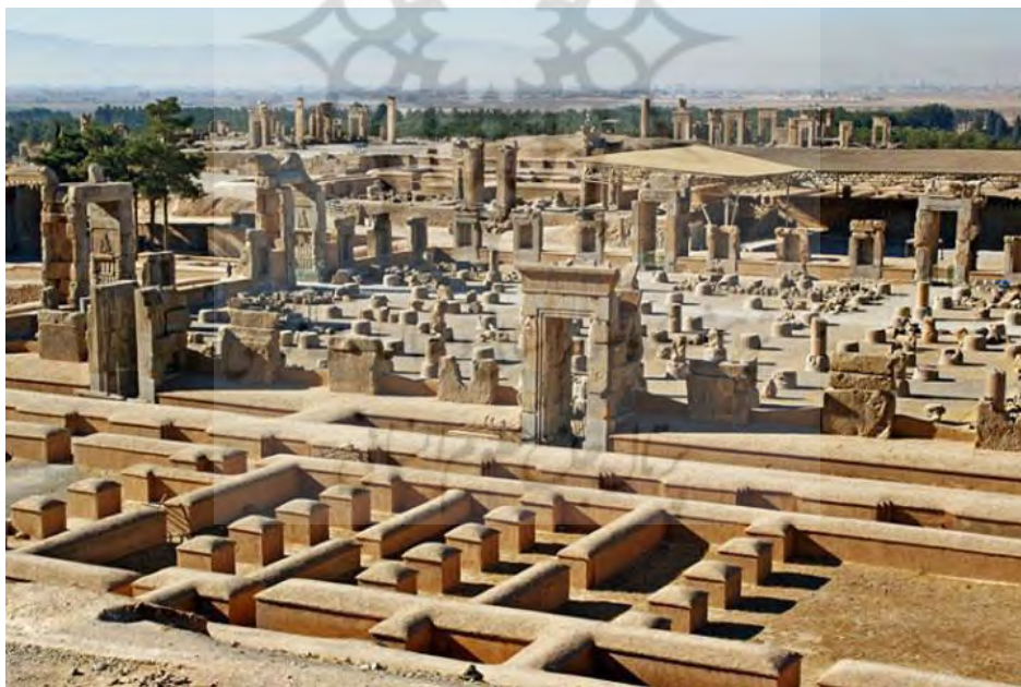
تصویر ۴. معماری تخت جمشید با ستون‌های متعدد

تمدن‌ساز فعال در اواخر عهد کهن و اوایل دوران میانه بود؛ یعنی تمدن یونانی- رومی (بیزانسی)، تمدن ایرانی، تمدن هندی و تمدن چینی و سپس ساسانیان طلایه‌داران و نمایندگان فرهنگی شدند که خود را در قالب دینی متمایز، هنری شناخت‌پذیر و شکل خاصی از سازمان اجتماعی و حکومتی به نمایش گذاشت، وجه دوگانه‌گرایی دین ایرانی بر وجود بدی و تمایل یکتاپرستی، تأکید کرده است (کمبریچ، ۱۳۹۸: ۳/ ۸۴-۸۵). تفکر کشورگشایان شرق باستان تا پیش از تأسیس دولت پارس و شاهنشاهی، چنین بوده که پس از شکست قوم و کشوری از هرگونه رفتار خلاف انسانی و اهانت به خدایان و پرستشگاه‌ها و پادشاهان فروگذار نمی‌کردند (سامی، ۱۳۸۹: ۳۵۵). به‌نظر می‌رسد که تخت جمشید پایتخت یا یکی از مراکز مهم فعال اداری، سیاسی و تشریفاتی هخامنشیان بود که در نوروز هر سال نیز یکی از مهم‌ترین مراسم‌های تشریفاتی- آیینی، یعنی جشن نوروز در آن برپا می‌شد (سلطان‌زاده، ۱۳۹۰: ۷۰-۷۱). از طرفی هیچ نوشته‌ای که کم‌ترین اشاره‌ای به یک عید رسمی به افتخار آن‌هاست که استقرار او درست از دوران اردشیر دوم آغاز شد، نمی‌کند (بریان، ۱۳۸۶: ۲/ ۱۴۲۴). در شهر پارسه یک معبد آن‌هاست و نیز بایگانی بزرگی وجود داشت و به‌دلیل اهمیت نمادین این شهر و با توجه به ویرانه‌های تخت جمشید، بهترین اثر تاریخی محفوظ‌مانده ایران باستان است (قدیانی، ۱۳۹۳: ۱۱۵). تصویر شماره ۴، سیستم گسترده معماری تخت جمشید را نشان می‌دهد که تأییدی بر عظمت این بنا و کاربری‌های متفاوت آن است.