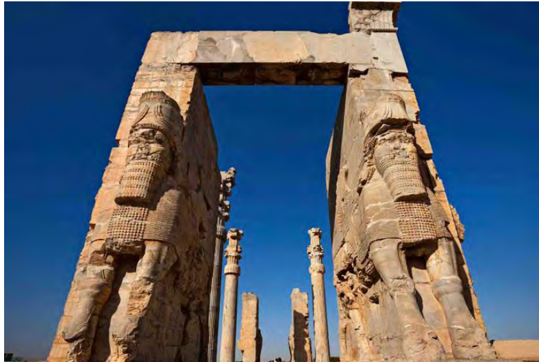
تصویر ۶. یکی از دروازه‌های تخت جمشید. استان فارس

هر مجموعه در درون فضاهای کالبدی در این شهرها، به‌گونه‌ای در ظاهر پراکنده‌شده و هر مجموعه در درون فضایی سبز که آن را از سایر فضاها جدا می‌کرد، احداث می‌شد (کلیکان و همکاران، ۱۳۵۰: ۸۳). در واقع، پارسه دارای یک مرکز تشریفاتی بود و یک نقطه کانونی برای نمایش قدرت پادشاه از ایدئولوژی سلطنتی، دامنه و عظمت قدرت پاریسی بود، این نماد میراث دولت هخامنشی است (وات رز، ۱۳۹۹: ۲۲۷). «در دوره هخامنشیان افزون بر شهرهای بابل، شوش، همدان، دو شهر پاسارگاد و تخت جمشید از مراکز بسیار مهم اداری و حکومتی بودند که از جنبه آیینی، مذهبی و تشریفاتی نیز اهمیت خاصی داشتند» (سلطانزاده، ۱۳۹۰: ۱۲).