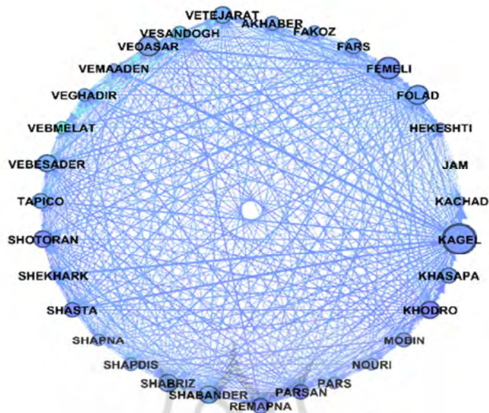
شکل ۱. شبکه سرریز تلاطم در سهام های شاخص سی شرکت در دوره حباب بازار سهام

بررسی شبکه سرریز تلاطم در سهام های شاخص سی شرکت: ... (سمانه باقری و دیگران) ۴۵