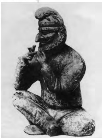
تصویر ۱۸- کلاه سکایی، از قدیمی‌ترین شکل کلاه ایرانی، تخت جمشید.