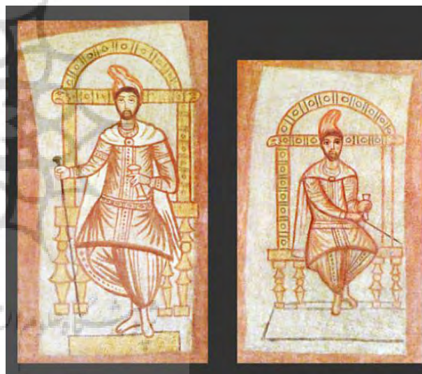
تصویر ۱۱- مرد پارتی، قاب دیواری، فرسک، دورا اروپوس، گالری هنرهای زیبا دانشگاه ییل.