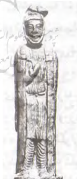
تصویر ۶- مجسمه‌ی نقره‌ای مرد مادی، موزه‌ی برلین (موزه استاتلش).

ماخذ: (سایت: www.shahnameh.ir ) (غیبی، ۱۳۸۸، ۸۵)