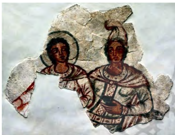
تصویر ۱۹- میترا به همراه سل، دورا اروپوس.

مارونی‌ها آن را بر سر می‌گذارند" (مقدم، ۱۳۸۸، ۷۳). امروزه نیز این کلاه به عنوان کلاه پاپ و کاردینال‌های کاتولیک نقش بازی می‌کند و اسقف‌ها نیز در مراسم رسمی خود از آن استفاده می‌کنند. پس به طور کلی می‌توان این چنین عنوان کرد که کلاهی که در ایران زمین معرف اقوام بود، به شکلی از طریق آیین میتراپی به اروپا راه یافت و اگرچه این آیین در ادامه و رشد مسیحیت از حرکت باز ماند، اما تجلیات بیرونی آن که یکی از آنها کلاه فریجی است، هم اکنون نیز به عنوان یادگاری از ایران در فرهنگ غربی به جای مانده است.