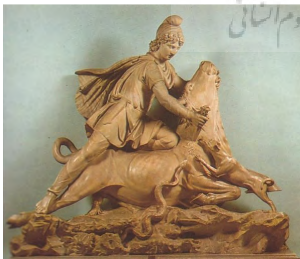
تصویر ۹- میترا در حال قربانی کردن گاو (تاور کتونی)، موزه واتیکان، ایتالیا.

اشکانی که آئین مهر به اروپا راه یافت، با آن همراه شد و با توجه به سالم ماندن آثار میترائیسم در اروپا، امروزه تأثیر آن را بر این مجسمه‌ها می‌توان مشاهده کرد.