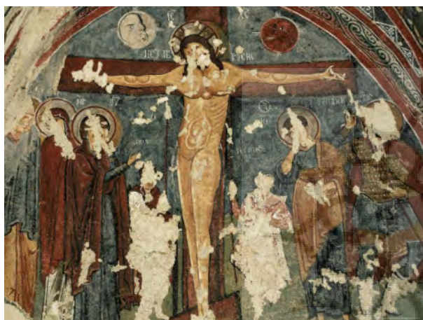
تصویر ۱۲- تصلیب عیسی مسیح، فرسک، کاپادوکیه.

یکی دیگر از پوشش‌هایی که در میترائیسم یا آیین مهر همواره به عنوان یک ویژگی مطرح بوده است، کلاه مهر یا میترا موسوم به کلاه فریجی بوده است. از دیر باز سرپوش به عنوان یکی از مهم‌ترین پوشش‌های ایرانی بوده است. نمونه‌های اولیه آن کلاه‌هایی است که اقوام ایرانی ماد، پارت و پارس همواره بر سر داشتند. "کلاه نزد قوم ماد گذشته از پوشاندن سر و صورت در مقابل سرما و گرما جنبه‌ی آرایشی و نمایشی نیز داشته است: جنبه‌ی نمایشی آن به ویژه در دوران فرمانروایی این قوم و پارس‌ها بیش تر به چشم می‌خورد" (غیبی، ۱۳۸۸، ۸۶).