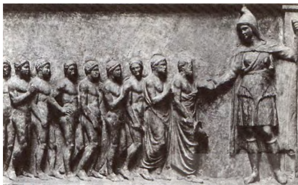
تصویر ۷- آرتیمیس، ایزد جنگاور، مشعلی را دریافت می‌کند. ماخذ: (ژبران، ۱۳۸۱، ۲۲۰)

رومی نیز کمتر پوششی مشاهده می‌شود، اگرچه مجسمه‌ها اگر پوششی به تن داشته باشند، در کمال ظرافت می‌باشد. لباسی که در نهایت می‌توان آن را تقلیدی ناخودآگاه از سبک پوشش ایران دانست و مصداق آن نقش برجسته‌ای است که مرد پارسی را در زنجیر و اسارت نشان می‌دهد (تصویر ۸). در مقایسه این تصویر با تصاویر متعددی که از نقش تاور کتونی بدست آمده است (تصویر ۹)، در نهایت می‌توان چنین