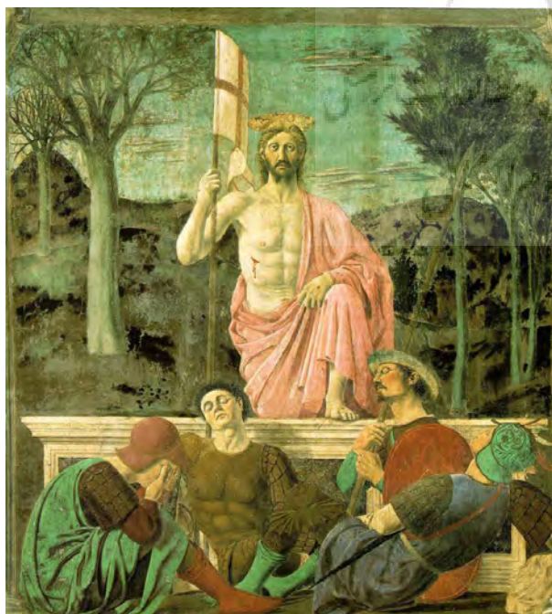
تصویر ۱۴- برده‌ی نقاشی حیات نو، پیترو دلافرانچسکا، مسیح با ردای قرمز.

آن را مسیحی می‌خوانیم، دین مهر در برگیرنده‌ی دین جهان غرب بود" (ثاقب فر، ۱۳۸۵، ۵). اما به سرعت مخالفت‌های آباب کلیسا آغاز شد و با تغییر دین امپراطور تا نابودی آیین مهر پیش رفت و به ظاهر به نظر می‌رسد که این آیین از صحنه خارج شد اما این شکل ظاهری موضوع است، چرا که با دقت در آیین و مناسک مسیحیت می‌توان در دل این دین بسیاری از اصول مهرپرستی را باز یافت. حتی در کوچک‌ترین مسایل می‌توان ردپای مهرپرستی را جستجو کرد تا آنجا که می‌توان گفت: "دین مهر دینی هست و خواهد بود که نقشی جدی در تاریخ پرورش دین و بر مسیحیت داشته است" (همان، ۵).