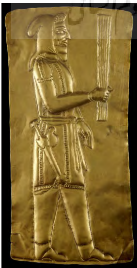
تصویر ۳- پلاک طلایی برسم بر دست، گنجینه ی جیحون، قرن هفتم تا ششم ق.م، موزه ی بریتانیا.

قوم ماد را به ما نشان می دهد. یکی از زیباترین نقوشی که در آن پوشش اقوام ایرانی بر ما نمایانده شده است، نقش برجسته‌ای مربوط به دوره هخامنشیان در تخت جمشید است که ملل هدیه آورنده را به تصویر کشیده است و این نقش، آیینی تمام نمای پوشاک اقوام است و تا حدودی ما را در ادامه یاری خواهد کرد (تصویر ۱). در تصویر الف، نمایندگان سکا و در تصویر ب، نمایندگان ماد به عنوان بخشی از نقش برجسته قابل مشاهده است. الزام این مقاله در ذکر این نقش برجسته، ردیابی پوشش میترا در نقوش بدست آمده و تطبیق آن با پوشاک ایرانی است.