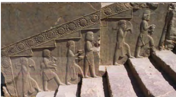
تصویر ۱۶- پلکان شرقی آپادانا، ملل هدیه آورنده، تخت جمشید.