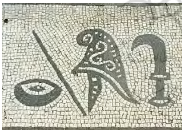
تصویر ۲۰- موزاییک بدست آمده از منطقه‌ی اوستیا، مرتبه هفتم آئین تشریف میترا، مقام پدر.

کلاه مادها و ساسانیان نیز به همین شکل است. این کلاه نیز بر سر برخی از بزرگان مهری در شاهنشاهی اشکانی و ساسانی و مانند آنها که در نقش رستم و بیشابور تراشیده شده دیده می‌شود" (ورمازرن، ۱۳۹۰، ۲۵). "مادها پوشش سر خود را حفظ کردند و آن عبارت بود از کلاه نرمی که یونانیان آن را فریجین می‌نامیدند و حدود دو هزار سال بعد انقلابیون فرانسه آن را به عنوان کلاه سرخ آزادی بر سر نهادند" (غیبی، ۱۳۸۷، ۷۷). اما در اروپا همان‌طور که قبلاً ذکر شد، پس از نفوذ آیین مهر، بیشترین تصویری که به چشم می‌خورد همان نقش گاوکشی است که در آن جوانی رعنا در حال قربانی کردن گاو است و یکی از مشخصه‌های اصلی این فرد که همان میترا است، کلاهی است که بر سر دارد. "در بیشتر پیکره‌های مهر می‌بینیم که مهر کلاه کیسه‌مانندی به گونه‌ی کلاه درویشان یا عرق چین نوک دار که نوک آن شکسته است و به طرف جلو و گاهی کنار عقب برگشته بر سر دارد، حتی در پیکره‌هایی که به جز کلاه چیز دیگری تن او را نپوشانده است، باز این کلاه را بر سر دارد" (مقدم، ۱۳۸۸، ۷۱). از قدیمی‌ترین تصاویری که در آن مهر با کلاهی فریجی یا نوک برگشته دیده می‌شود، فرسکی است که در دورا اروپوس میترا را همراه با سل خدای خورشید نشان می‌دهد (تصویر ۱۹). این مشخصه را اگرچه به لحاظ تصویری در ایران نمی‌توان پیگیری کرد، اما در متون گذشته‌ی این مرز و بوم از جمله اوستا می‌توان دید. "در اوستا از مهر چنین یاد می‌شود، مهر زیناوندی است که کلاه خود بر سر، زره در بر، سپر سیمین به دوش و گرز گران در دست دارد و بر گردونه‌ی زرین مینوی که دارای سوار است" (باقری، ۱۳۸۹، ۱۴۴).