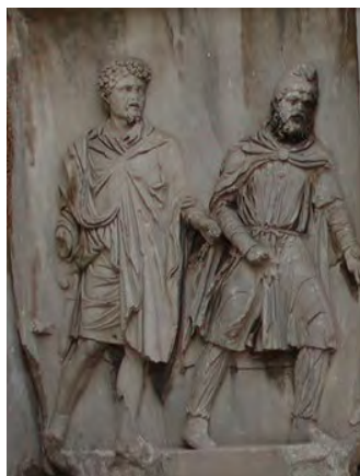
تصویر ۸- مرد پارسی در اسارت سرباز رومی نقش شده بر قوس سپتسموس سوروس، ۲۰۰ میلادی، رم.