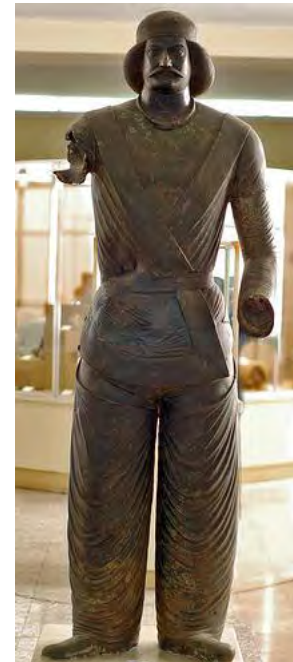
تصویر ۵- مجسمه‌ی نجیب‌زاده‌ی اشکانی، منطقه‌ی شمی، سده‌ی دوم ق.م، موزه ایران باستان.

ماخذ: (سایت: www.shahnameh.ir ) (غیبی، ۱۳۸۸، ۸۵)