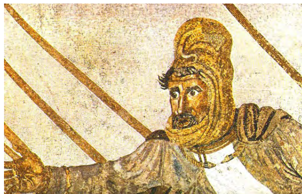
تصویر ۱۰- داریوش هخامنشی، موزاییک نبرد اسکندر و ایرانیان، موزاییک، موزه ملی ناپل، ایتالیا.

نتیجه‌گیری کرد که میترا غربی همان ایزد مهر ایرانی است چرا که پوششی ایرانی به تن دارد و این پوشش همان پوششی است که در دوران متفاوتی در ایران مورد استفاده بوده است. این لباس شامل شلوار، پیراهن که دارای چین خوردگی به نشانه‌ی