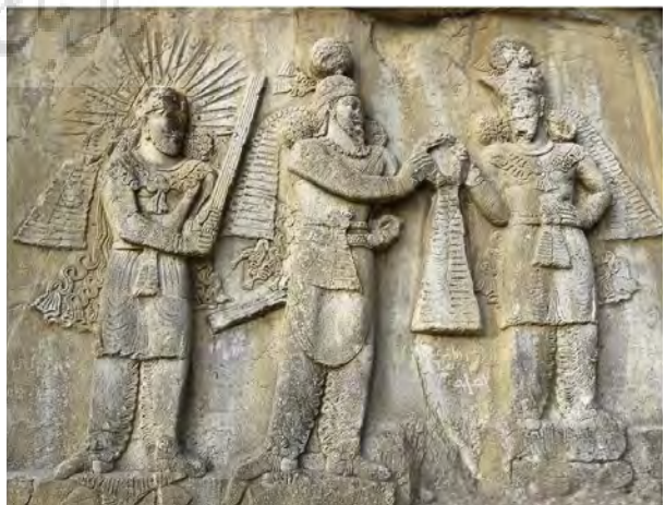
تصویر ۲- تصویر اعطای مقام شاهی در سنگ نگاره ی طاق بستان، سده چهارم میلادی.

بی شک یکی از مهم‌ترین وجوهی که از آن می توان به ماهیت ایرانی ایزد مهر یا میترای غربی پی برد، پوشاک اوست که در این بخش به بررسی و تحلیل آن خواهیم پرداخت. از قدیمی‌ترین نقوشی که در ایران مربوط به ایزد مهر است، نقش که در طاق بستان وجود دارد و می توان آن را یکی از محدود نقش برجسته‌های بر جای مانده در ایران دانست که مهر در آن به روشنی نقش بسته است. در این نقش برجسته، ایزد مهر لباسی بر تن دارد که نوعی لباس رایج در دوره ساسانی است. این لباس شامل شلوار چین داری است که به نوعی شباهت به شلوارهای دوره سلوکی و اشکانی دارد، در این نقش اهورامزدا در حال اعطای مقام شاهی به پادشاه است. " در این نقش برجسته هر دو شلوار به پا دارند که از جانب داخل پا چین خورده و به وسیله‌ی بندی به مچ پا چسبیده و هر یک کمر بند و گردن بند و دستبندهایی دارند" (کریستینسن، ۱۳۸۸، ۱۸۷). بالا پوش آن تا بالای زانو بوده بروی آن شالی بسته شده است و بر روی بالا پوش شنلی وجود دارد که یکی از اجزایی است که در نقوش این دوره به چشم می خورد. " ساسانیان گاهی از شنل به عنوان لباس رو و لباسی که نشانه‌ی اشرافیت و پادشاهی بود، استفاده می کردند،