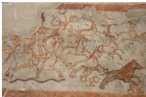
تصویر ۱۲- نقش شکار میترا در نخجیرگاه، فرسک، دورا اروپوس، سوریه.