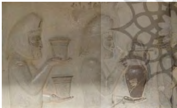
ب) گروه نمایندگان مادی در حال آوردن هدایا، تخت جمشید پلکان شرقی آپادانا، قرن ششم تا پنجم ق.م.