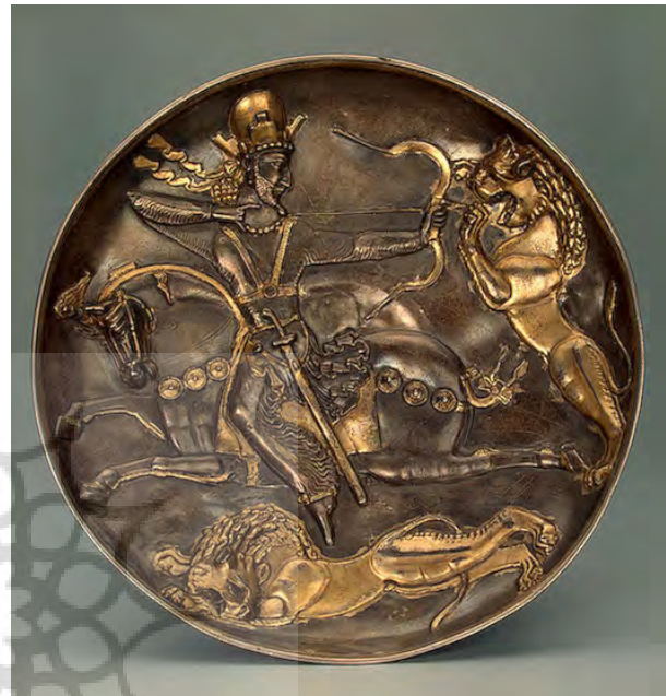
تصویر ۴- بشقاب شاپور دوم در حال شکار شیر، موزه ی آرمیتاژ.

از زیباترین پوشاک دوره ساسانی، شلواری است که در بیشتر نقوش برجسته‌ی این دوره با توجه خاصی همراه جزئیات به دیواره‌های سنگی حک شده است. البته با توجه به تصاویر بدست آمده از نقوش برجسته و ظروف فلزی (تصویر ۴) و مقایسه این تصاویر با گذشته می‌توان دریافت که ساسانیان تا حدی میراث‌دار اقوام حاکم پیش از خود بر این سرزمین در دوران گذشته بوده‌اند (تصویر ۳). شلواری که ایزد مهر پوشیده است، شلواری