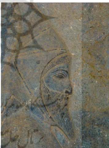
تصویر ۱۷- کلاه سکایی، از قدیمی‌ترین شکل کلاه ایرانی، تخت جمشید.