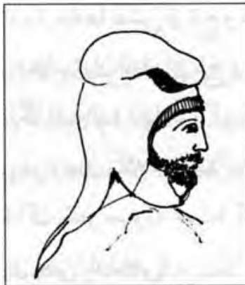
تصویر ۱۵- باشلق مادی، قرن ۵ ق.م. ماخذ: (غیبی، ۱۳۸۸، ۸۹)

این کلاه با توجه به نفوذ بسیار زیاد آیین مهر به نقاط مختلفی از جهان راه یافت، تا آنجا که حتی در بعضی از زمان‌ها مفاهیم خاص خود را گرفت. البته بیش از آنکه این کلاه را سکایی بدانیم، باید ریشه‌ی آن را در سکاها دنبال کنیم، چراکه