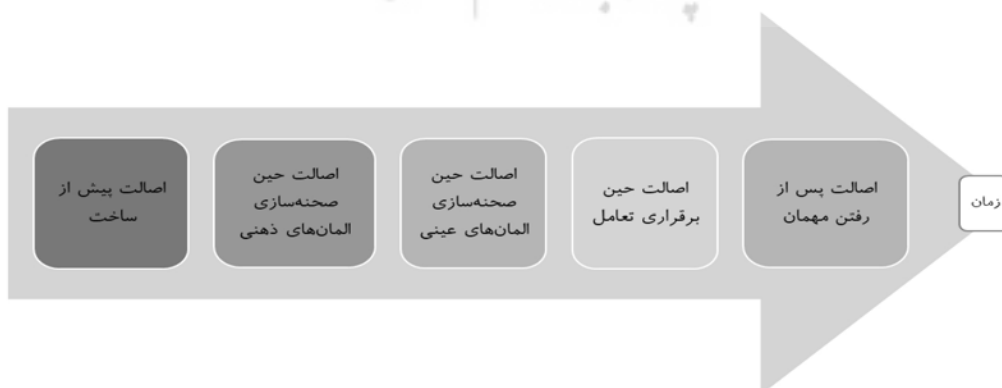
شکل ۱: فرایند عرضه اصالت در اقامتگاه بوم‌گردی براساس زمان عمر اقامتگاه

در این مطالعه نیز، اگرچه همه مقولات ماتریس تحلیل دارای زیرمقولات بودند، برخی از زیرمقولات در قالب هیچ‌یک از مقولات ماتریس تحلیل نگنجیدند. بنابراین، مقولات جدیدی با روش استقرایی از متون استخراج شدند. درنهایت، ۵ مضمون از بین ۳۵ مقوله استخراج شده کشف شد که در جدول ۲ ارائه شده‌اند.