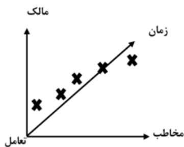
شکل ۱: ارائه اصالت در امتداد زمان در بستر تعامل بین مالک و گردشگر (استخراج شده از نتیجه پژوهش)

اصالت حساسیت جدید مشتریان ۱ است (Gilmore & Pine, 2007). در چنین وضعیتی، ارائه دهنده خدمت برای این که موفق شود باید با طراحی راهبردهای جدید بدان پاسخ دهد. بنابراین، نکته مهم این است که، اگرچه موضوع اصلی این مطالعه اقامتگاه‌های بوم‌گردی است، ارائه اصالت در بستر هر ارتباط متقابلی بین ذی‌نفعان صنعت گردشگری ممکن و تاحدودی الزامی است.