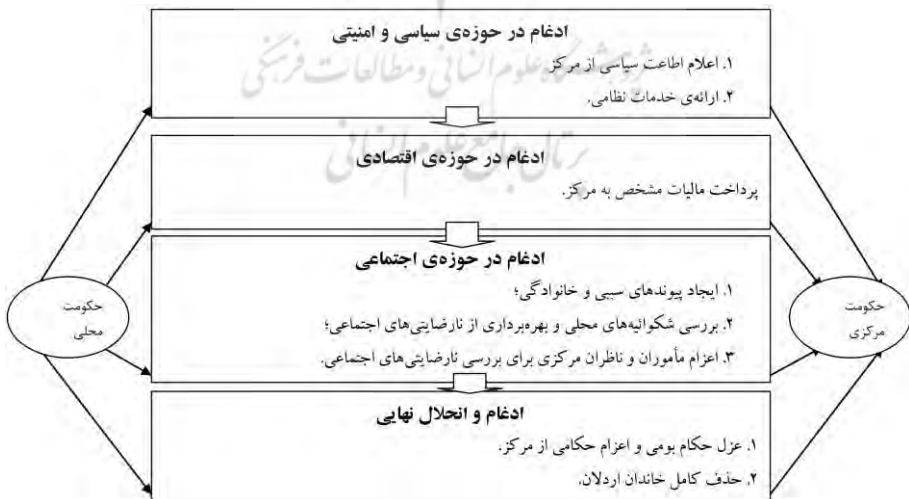
شکل ۱: فرآیند تدریجی مراحل ادغام حکومت محلی در حاکمیت مرکزی

در پی برخوردهای ایران و عثمانی بر سر این مسئله در دوره ی قاجار، اهمیت حضور اردلان ها در مرزهای غربی ایران بر قاجارها نیز آشکار شد؛ اما با کاهش اختلافات طرفین از دوره ی محمد شاه قاجار و انعقاد عهدنامه ی دوم ارزنه الروم و حذف حاکم نشین بابان سه سال پس انعقاد این عهدنامه (۱۲۶۷)، دست ایران برای همیشه از دخالت در امور شهرزور و سلیمانیه کوتاه شد (بابانی، ۱۳۷۷: ۱۶۹) و جایگاه و نقش اردلان ها در مرزهای غربی ایران کم اهمیت تر شد که این مسئله در انقراض آنان بی اثر نبود (بهرامی، ۱۳۸۹: ۱۹-۲۱).